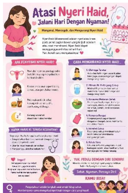
Gambar 1. Media poster digunakan untuk pendidikan bagi mahasiswa kebidanan UNRIDA.

Kegiatan pengabdian masyarakat berupa edukasi untuk mengurangi nyeri haid pada mahasiswi kebidanan di UNRIDA Rengat, Kabupaten Indragiri Hulu, Riau, bertujuan untuk meningkatkan pengetahuan dan pemahaman mereka mengenai nyeri haid dan penanganannya. Sasaran kegiatan ini adalah mahasiswi UNRIDA Rengat. Kegiatan dimulai dengan pembagian lembar pre-test yang berisi tujuh pertanyaan untuk menilai pengetahuan awal mahasiswi sebelum kegiatan edukasi. Materi disampaikan oleh penulis, seorang Dosen Kebidanan di UNRIDA. Peserta diminta untuk mengisi lembar pre-test. Terdapat 7 responden yang menjawab pertanyaan dengan skor 89 dan setelah post-test, 9 dari 11 responden mendapatkan skor 96 dalam menjawab pertanyaan, sehingga terjadi peningkatan skor jawaban pertanyaan karena adanya pemahaman penyampaian materi edukasi mengenai nyeri haid dari penyaji setelah edukasi dilakukan. Kegiatan ini dilakukan dengan menggunakan media poster yang ditampilkan di layar TV sehingga mahasiswi dapat melihat dengan jelas isi materi pada poster yang telah dipresentasikan.