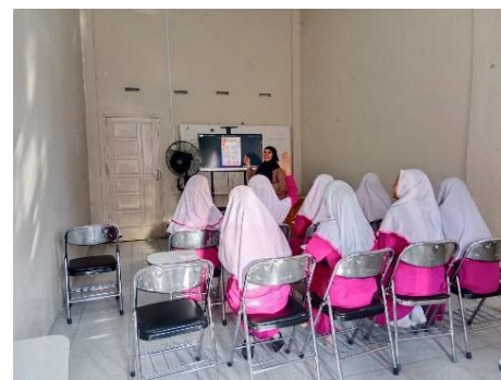
Gambar 3. Dokumentasi Kegiatan